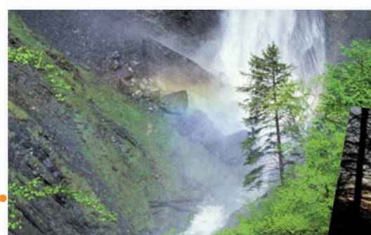
Cascade d Confolens, JP. Nicollet