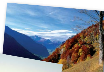
Automne en Valbonnais, JP. Nicollet