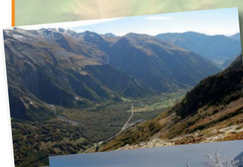
Vallée de la Malsanne, S. Jendouby