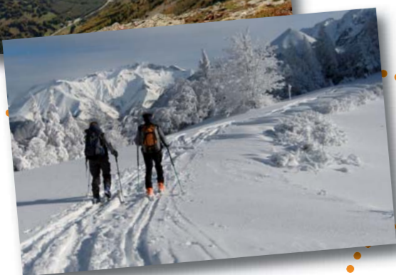
Col de Parquetout, S. Durix