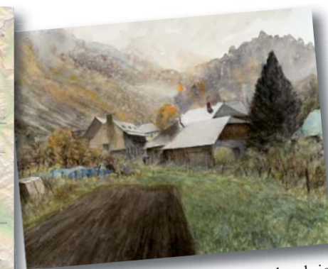
Le Périer sous-la pluie, D. Clavreul