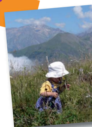
Colombier, M. Digier